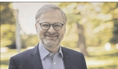
Rozdíl mezi námi a vámi? Sobě jsme zvedli platy a vám daně!