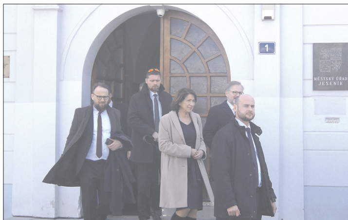
Úprk premiéra Petra Fialy z jesenické radnice.

Na závěr došlo i na dotazy z publika, kterým se budeme podrobněji věnovat v samostatném článku. (ma)